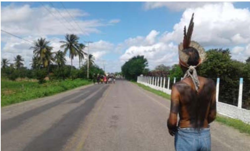
Figura 1 - Toré na interdição da AL 225.

Keywords: Indigenous people of the Northeast. Toré. Ethnicity. Indigenous resistance.