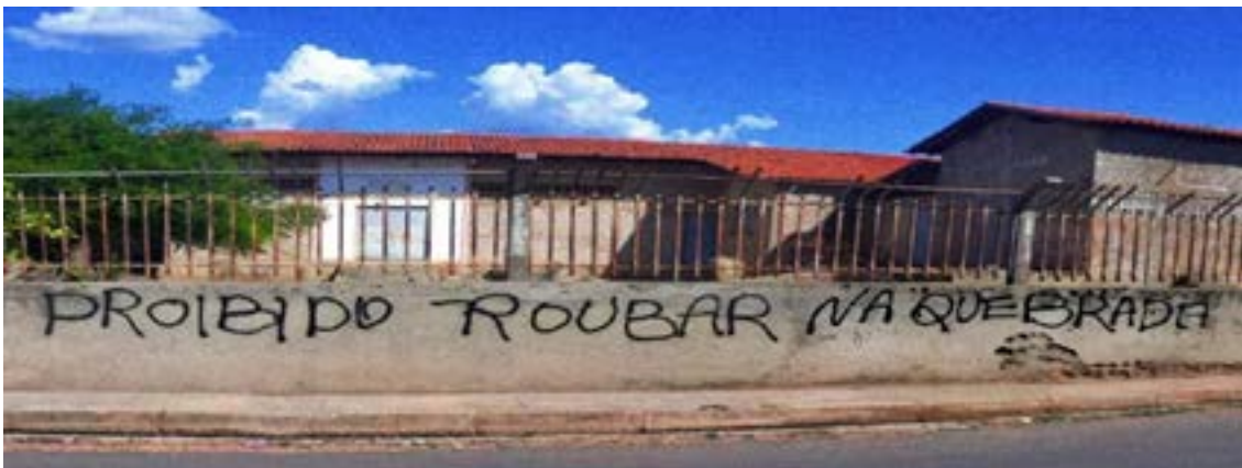
Foto retirada pelo autor em periferia da zona sul de Teresina 2019.

Dessa forma, em uma quebrada é possível ver efeitos do PCC em todos os lados, ainda que o movimento não se mostre nítido ou explícito nesses efeitos – eles podem ser vistos, por exemplo, no vocabulário utilizado pelos moradores da quebrada ou até mesmo na relação de proteção e segurança da comunidade.