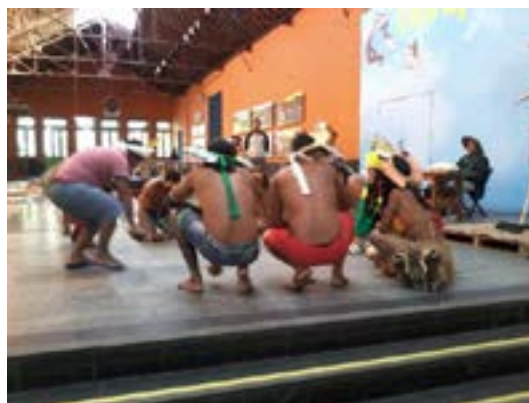
Figura 2 - Toré no Festival de Cultura Indígena.

Ao chegar ao Festival, Kayrrá cumprimentou e conversou com outros indígenas que o conhecia por participar de eventos semelhantes. No Festival, havia a venda de produtos indígenas e aqueles que quisessem se apresentar ao grande público (formado por indígenas e não indígenas) poderiam fazê-lo. Foi então que os Kariri-Xocó (Alagoas), os Pataxó (Bahia) e os Fulni-ô (Pernambuco) apresentaram o Toré.