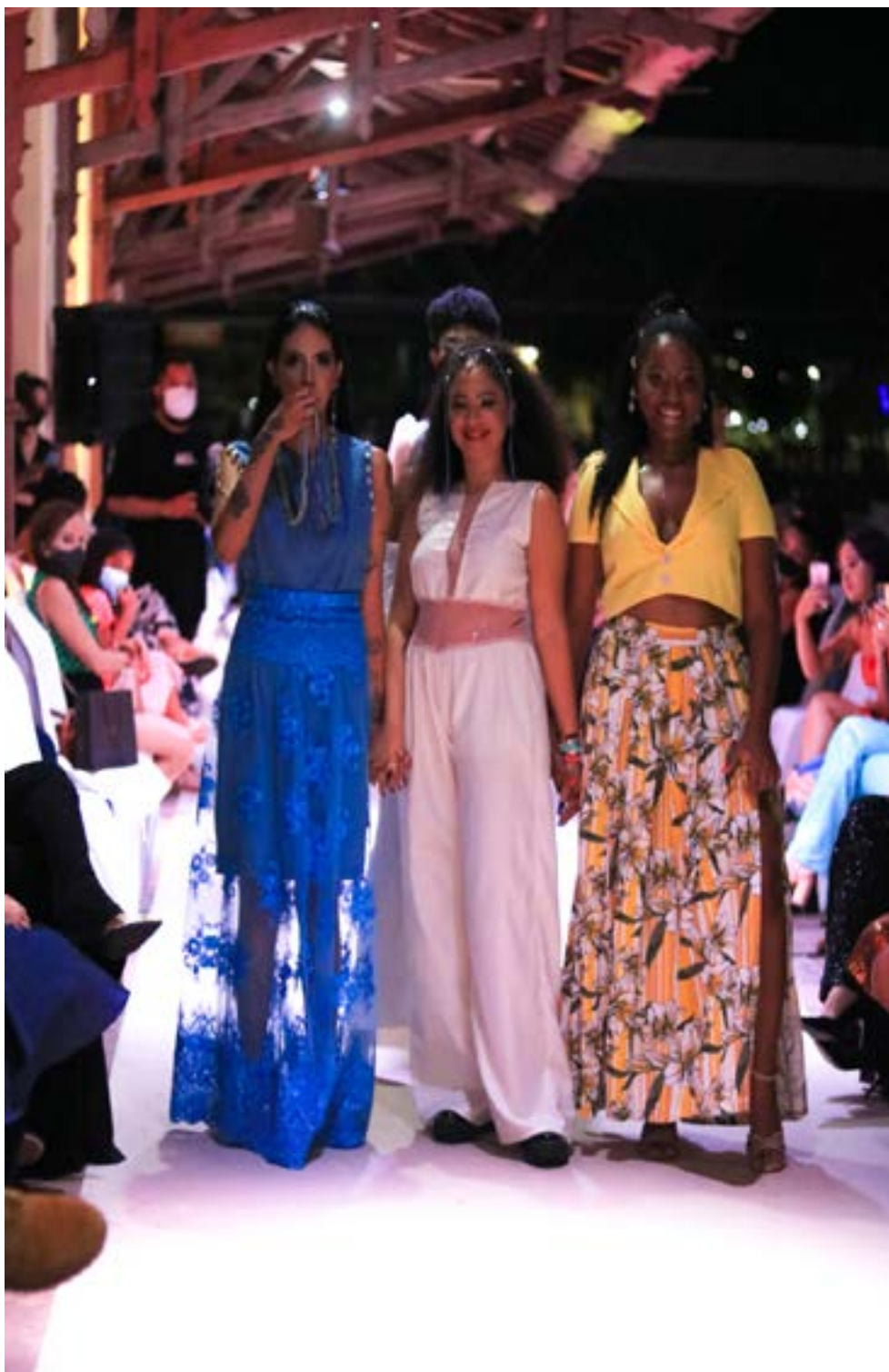
Fotografia tirada por Korina Rodrigues em 2021 durante o desfile da coleção.