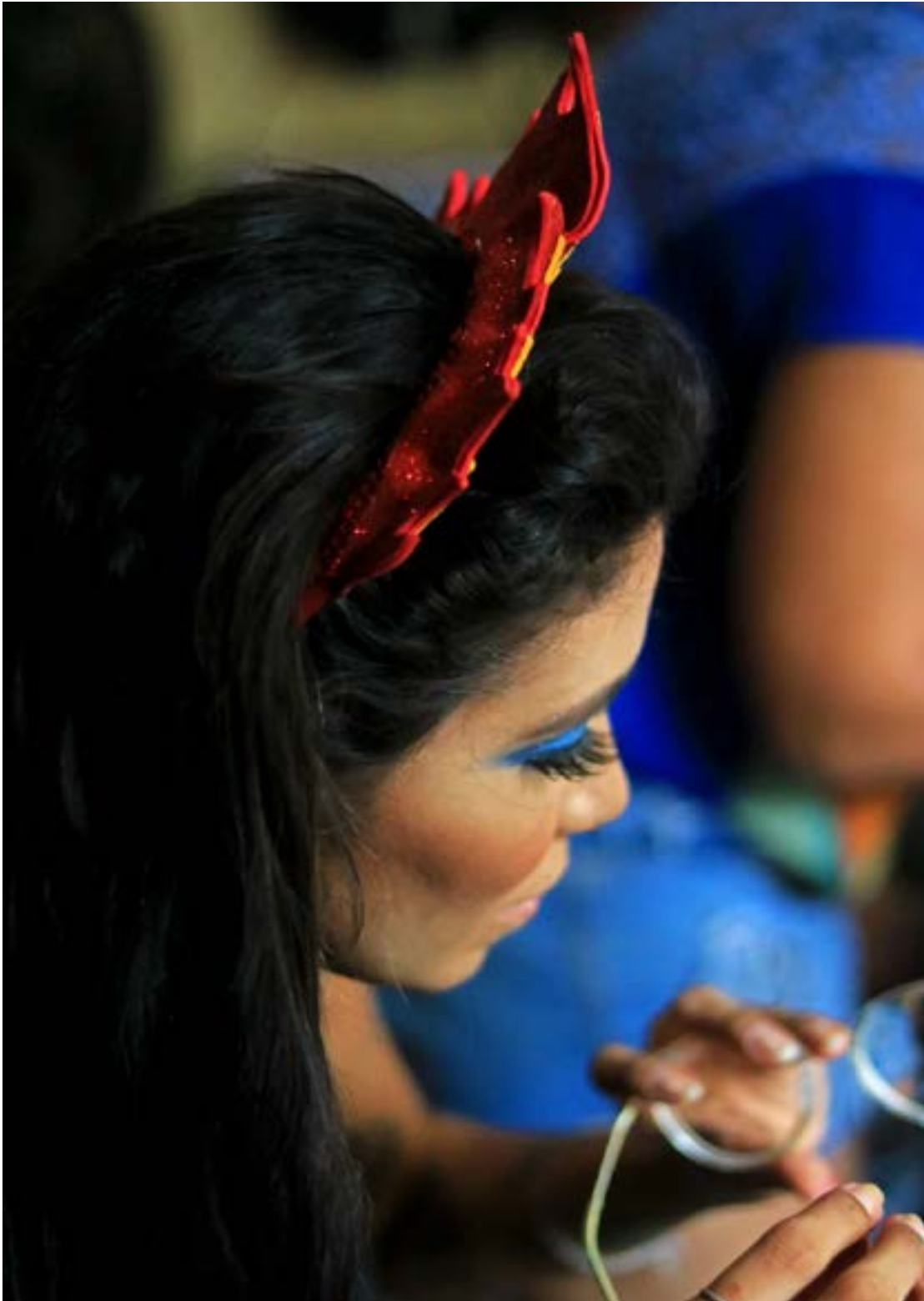
Fotografia tirada por Korina Rodrigues em 2021 durante o desfile da coleção. Modelo vestindo roupas que representam as cores do orixá Oxóssi.