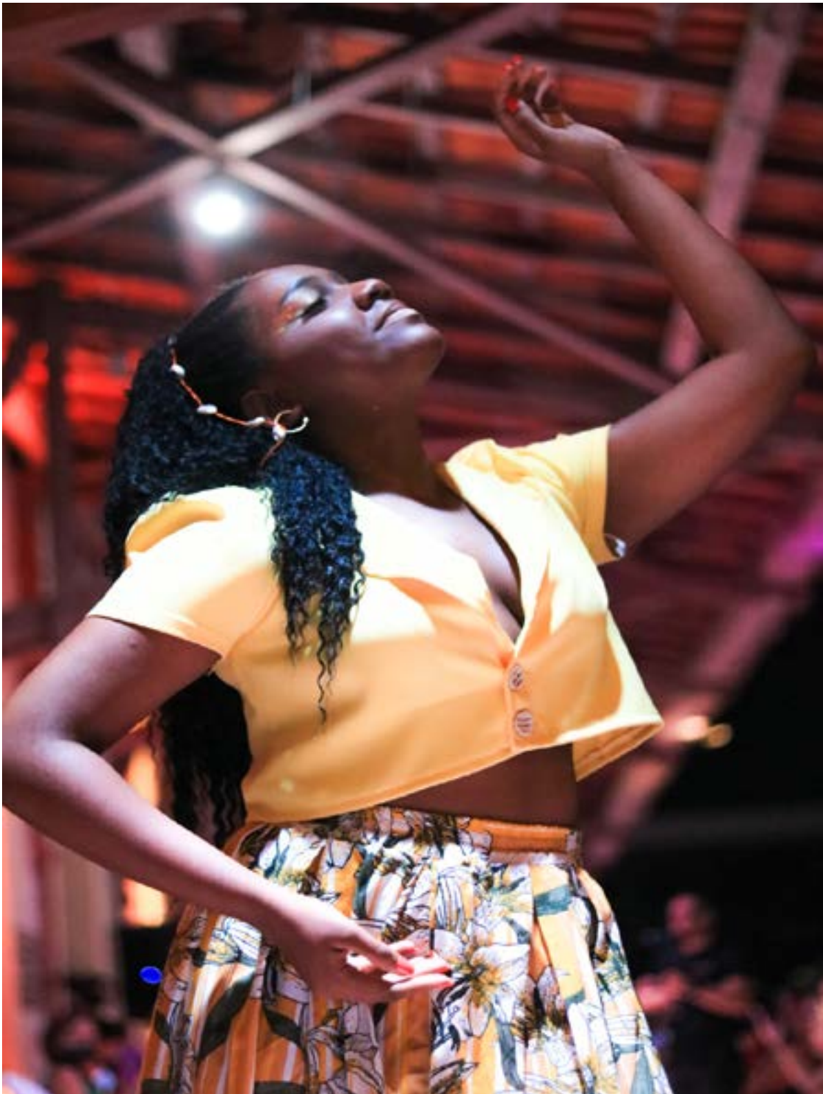
Fotografia tirada por Korina Rodrigues em 2021 durante o desfile da coleção. Modelo vestindo roupas que representam as cores do orixá Oxum.