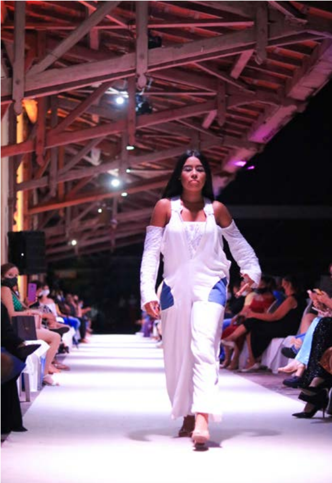
Fotografia tirada por Korina Rodrigues em 2021 durante o desfile da coleção. Modelo representando trajes que lembram as cores de Oxalá.