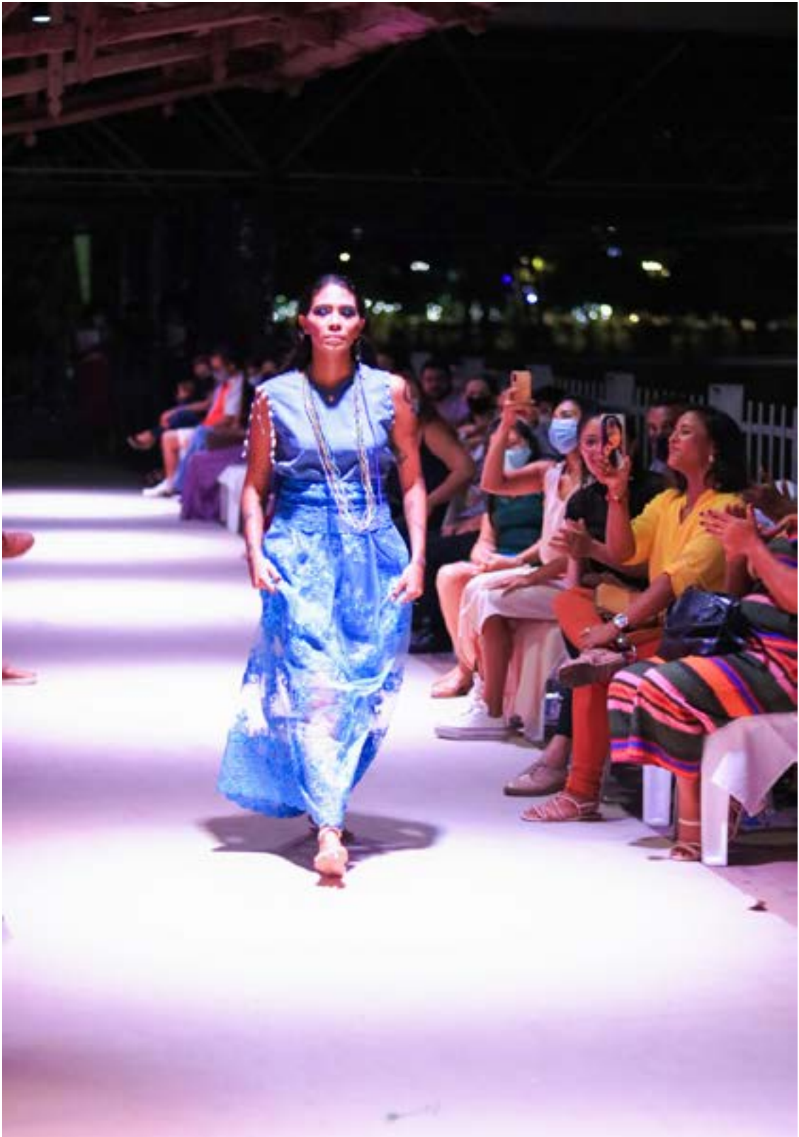
Fotografia tirada por Korina Rodrigues em 2021 durante o desfile da coleção. Modelo vestindo roupas que representam as cores do orixá Oxóssi.