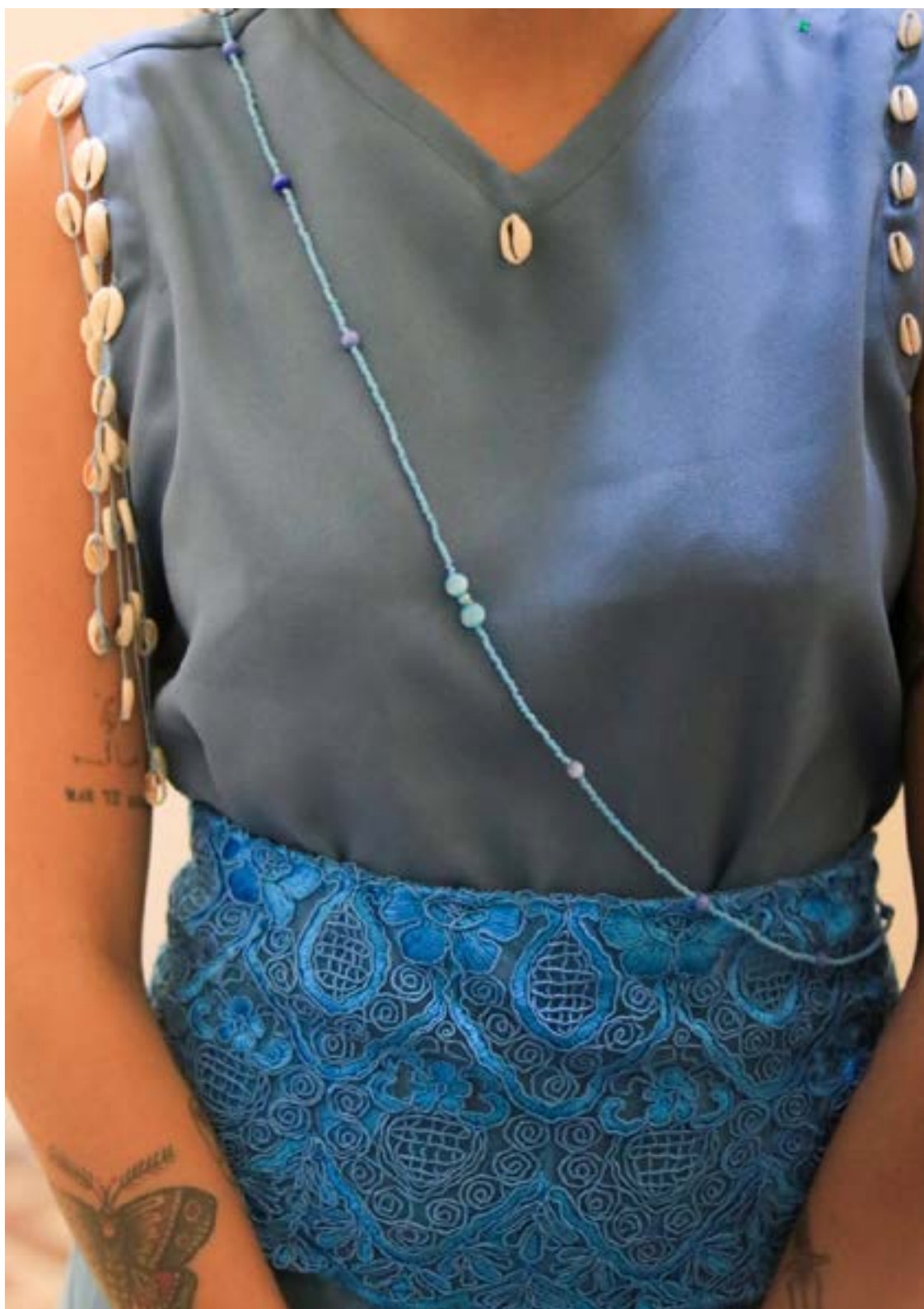
Fotografia tirada por Korina Rodrigues em 2021 durante o desfile da coleção. Modelo vestindo roupas que representam as cores do orixá Oxóssi.