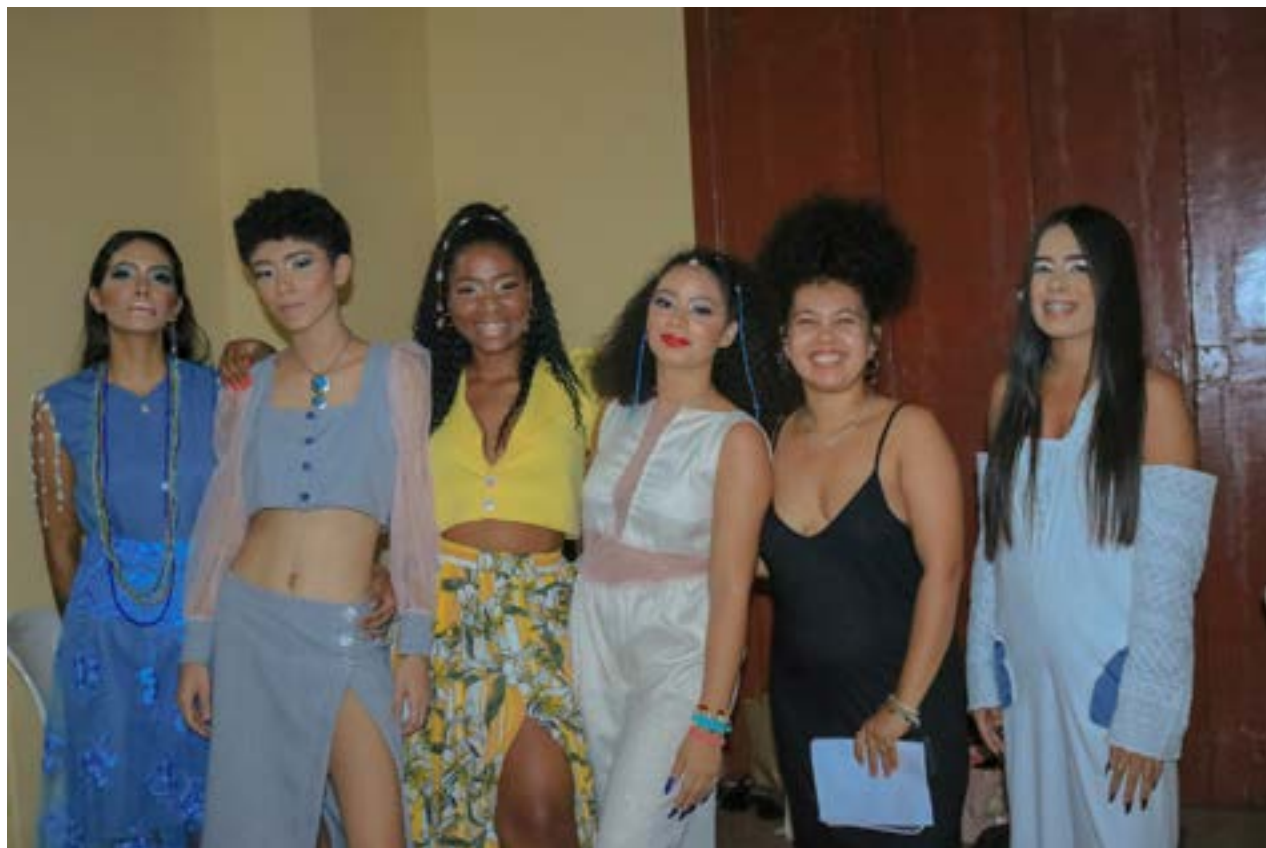
Fotografia tirada por Korina Silva em 2021 durante o desfile da coleção.