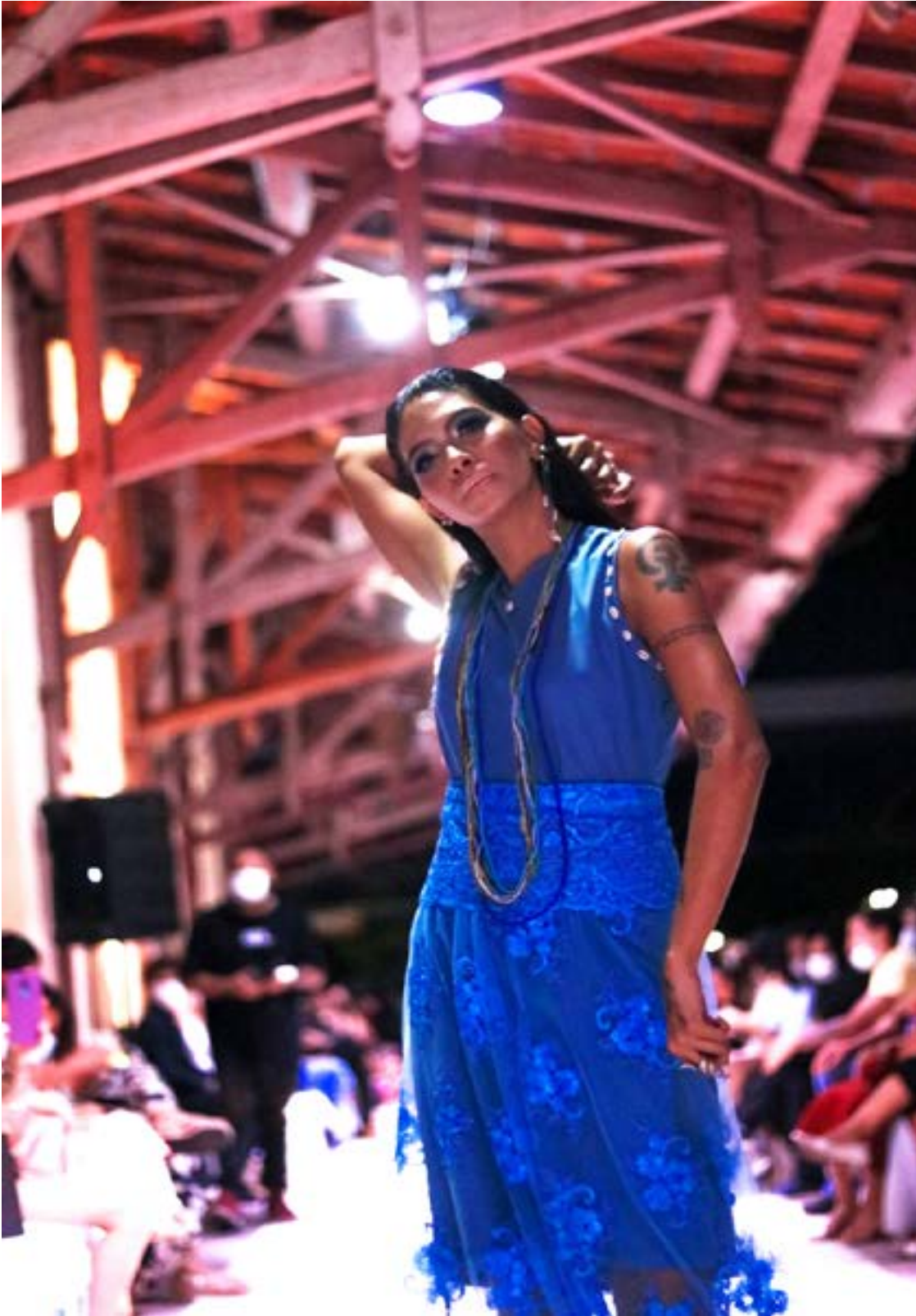
Fotografia tirada por Korina Rodrigues em 2021 durante o desfile da coleção. Modelo vestindo roupas que representam as cores do orixá Oxóssi.