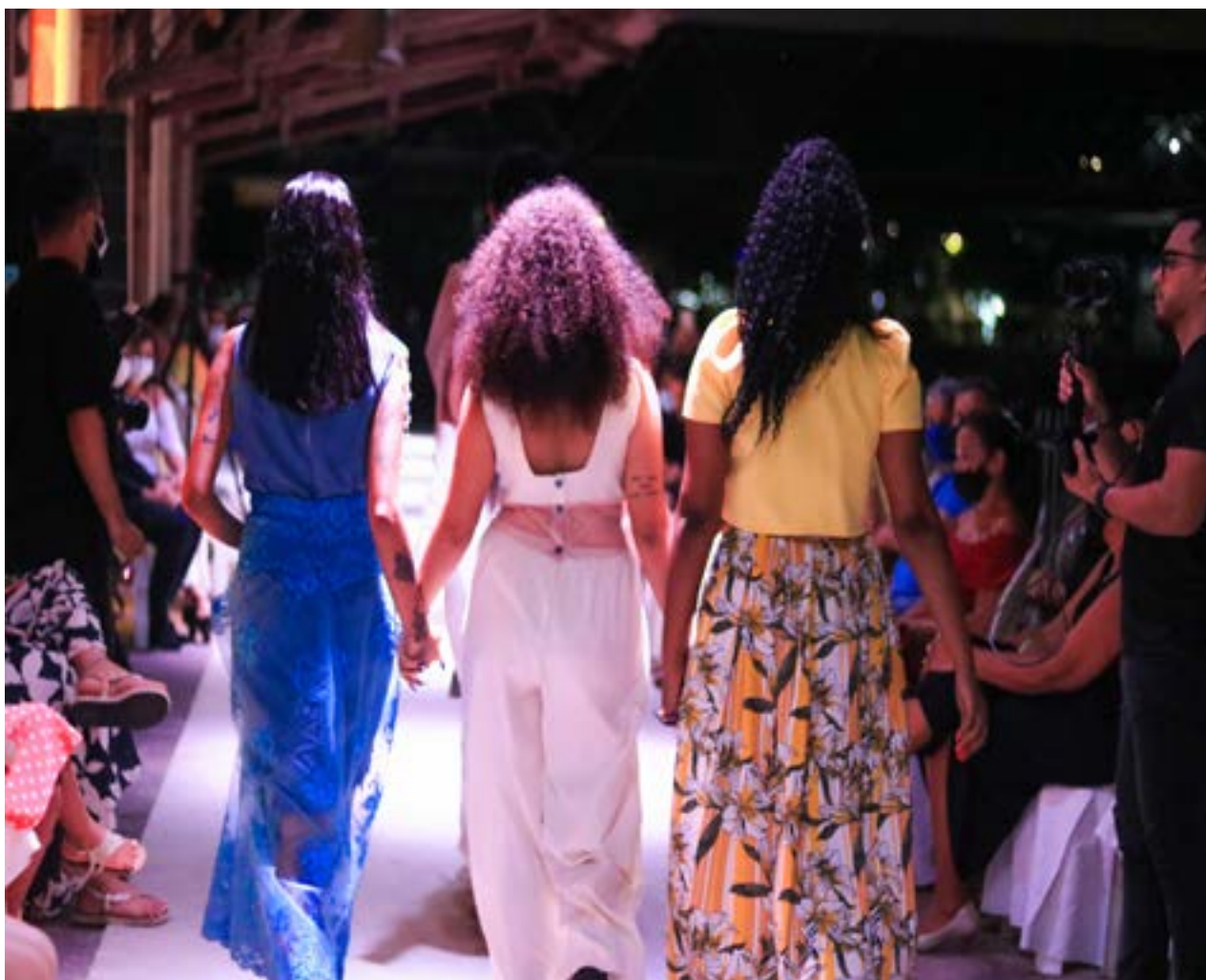
Fotografia tirada por Korina Rodrigues em 2021 durante o desfile da coleção.

Asa vivência que tenho em ser de candomblé, foram essenciais para desenvolver essa coleção. Ter renascido através dele é sobre amar o que sou hoje, algo que só o candomblé e os orixás me proporcionaram. Quando eu cheguei no candomblé, em 2017, estava desacreditada, sem fé na vida, e em mim, além de não conseguir visualizar uma perspectiva de vida.. Quando eu comecei a me cuidar, fui resgatando aos poucos tudo que perdi ao longo da vida.