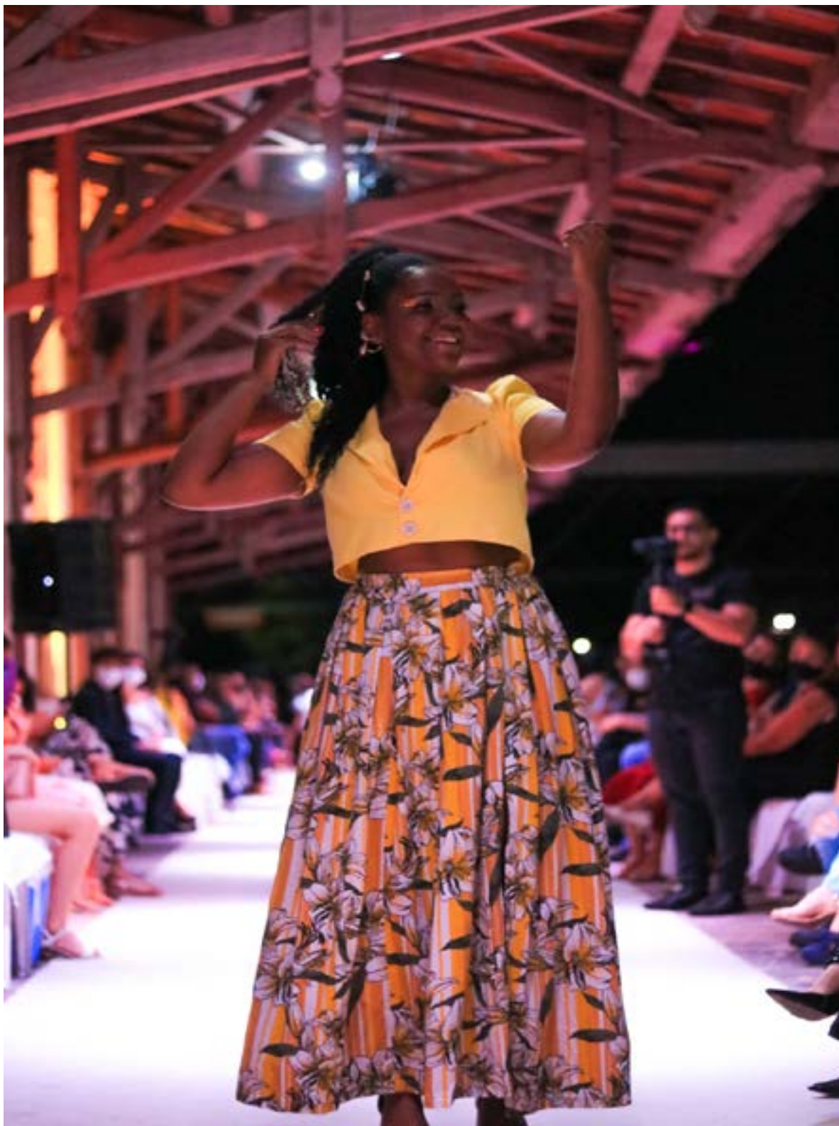
em 2021 durante o desfile da coleção. Modelo vestindo roupas que representam as cores do orixá Oxum.