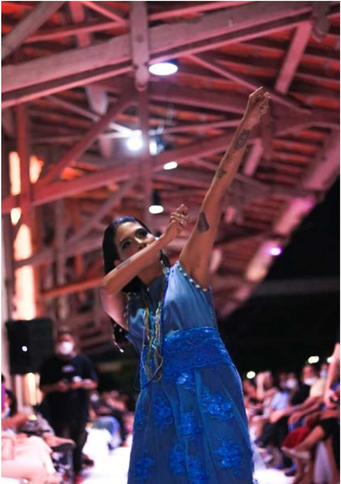
Fotografia tirada por Korina Rodrigues em 2021 durante o desfile da coleção. Modelo vestindo roupas que representam as cores do orixá Oxóssi.