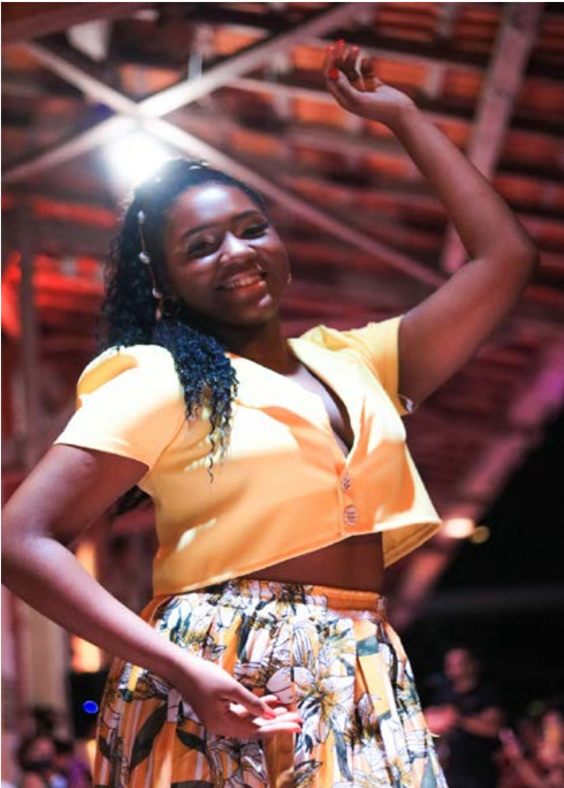
Fotografia tirada por Korina Rodrigues em 2021 durante o desfile da coleção. Modelo vestindo roupas que representam as cores do orixá Oxum.