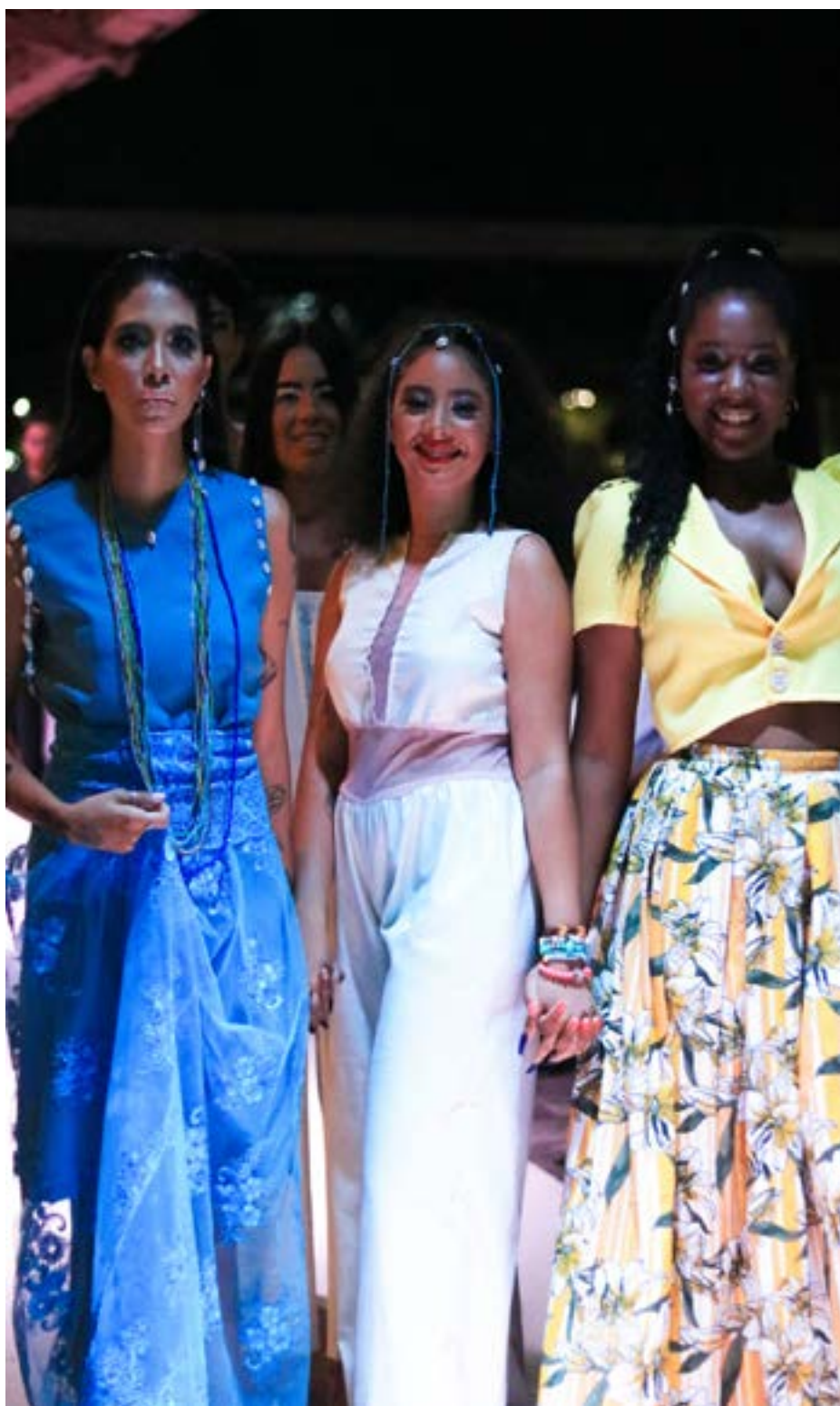
Fotografia tirada por Korina Rodrigues em 2021 durante o desfile da coleção.