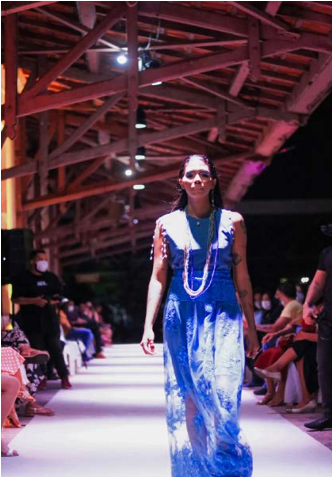
Fotografia tirada por Korina Rodrigues em 2021 durante o desfile da coleção. Modelo vestindo roupas que representam as cores do orixá Oxóssi.