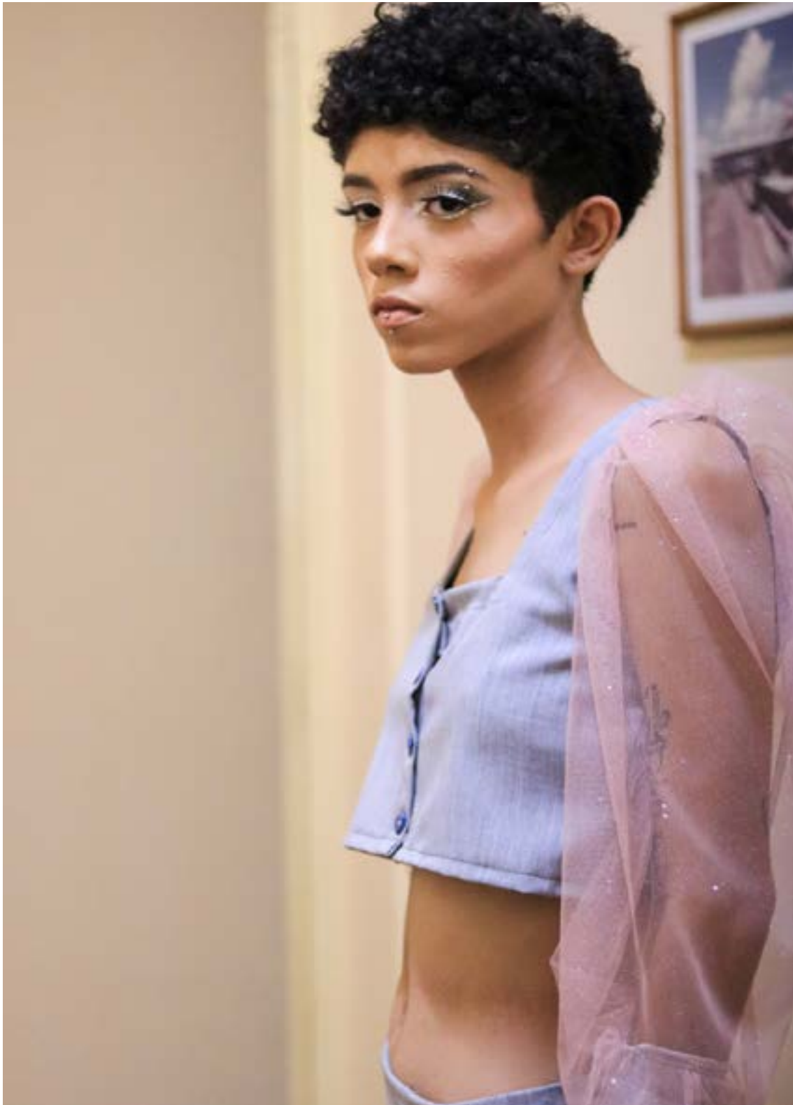
Fotografia tirada por Korina Rodrigues em 2021 durante o desfile da coleção. Modelo vestindo roupas que representam as cores do orixá Ayrá.