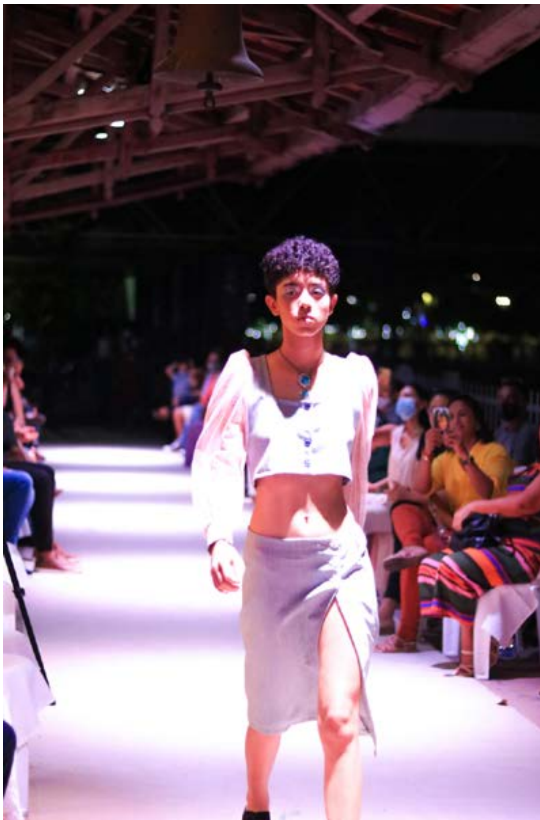
Fotografia tirada por Korina Rodrigues em 2021 durante o desfile da coleção. Modelo vestindo roupas que representam as cores do orixá Ayrá.