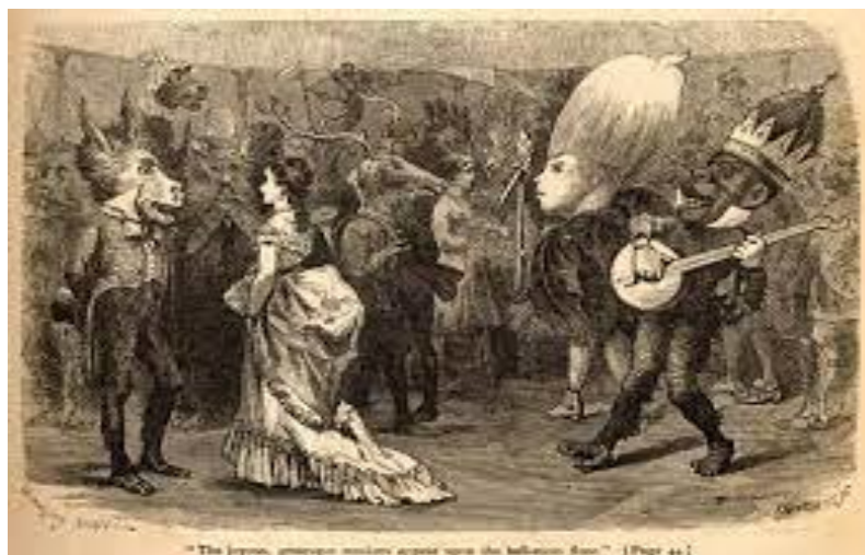
Figura 3: O carnaval como um evento social

No decorrer de seu trajeto teórico, o Círculo de Bakhtin dedicou-se a investigar sobre objetos teóricos como o signo ideológico, os enunciados, a interação e as relações sociais, entre outros. Ao estudar as formas populares de comemoração e com base no renascentista Rabelais, Bakhtin (1981, 1997, 2000) define a carnavalização como um processo de apropriação da literatura renascentista em torno das manifestações da cultura popular medieval, com base principalmente em sua natureza não oficial, configurando um olhar crítico que seria moldado pela suspensão de todas as hierarquias, transformando o mundo real às avessas.