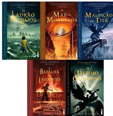
Figura 1: saga “Percy Jackson & os Olimpianos”, de Rick Riordan