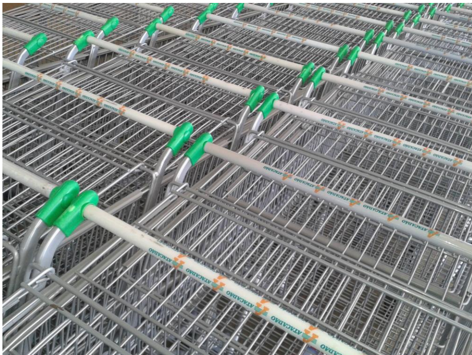
Figura 1: PINHEIRO, André. Ritmo industrial , câmera de celular, 2015.