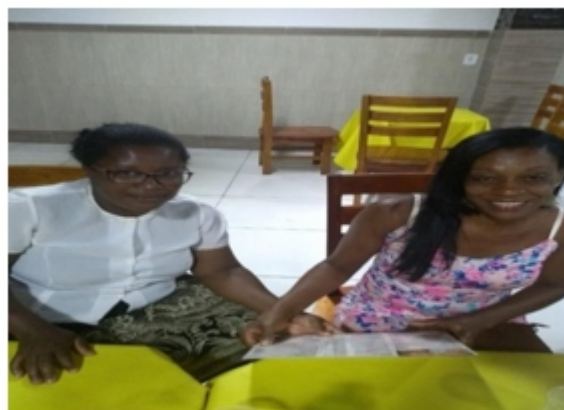
Figura 4. Confraternização na pizzaria