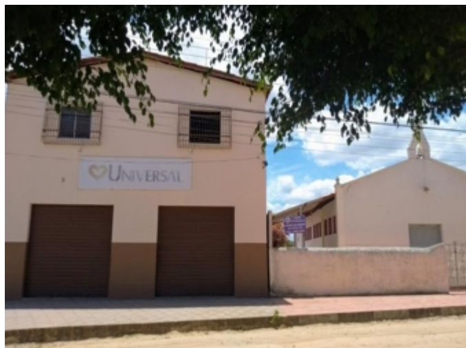
Figura 1. Igreja Universal e Capela da Igreja católica de São José são vizinhas