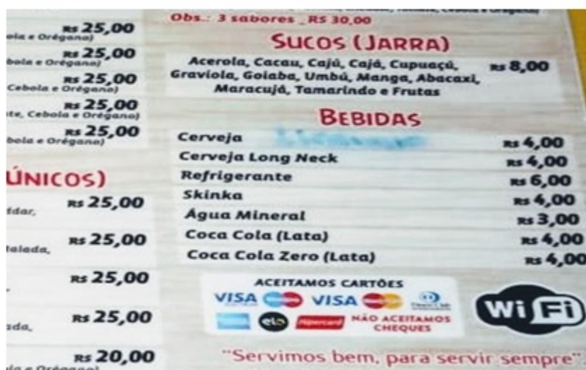
Figura 5. Cardápio da Pizzaria

Ao serem questionadas sobre como elas sabiam onde ficavam o espaço dos sucos, Rosa e Pérola responderam, quase juntas: “pelo tamanho da palavra, suco é uma palavra pequena, pró”, “a parte de bebida fica embaixo”, “ - Olha aqui: BE-BI-DAS”, informou Rosa.