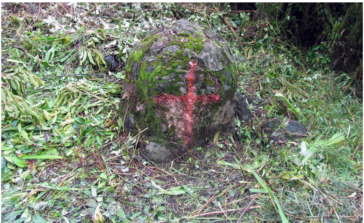
Ilustración 1. Mojonera La Lagunilla en tierras comunales de Capulálpam.