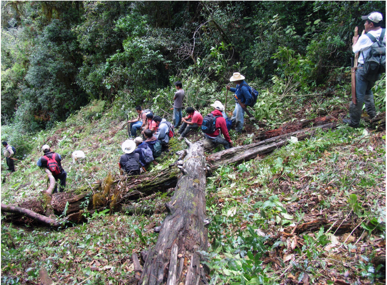
Ilustración 4. Trabajar en el reconocimiento de linderos alimenta las ontologías políticas territoriales.

Las interacciones territoriales cotidianas son cruciales en las construcciones de la memoria y la representación política. Las prácticas de posesión territorial como los recorridos por el territorio para reafirmar límites, las posesiones territoriales de familias y las distribuciones de tierras de uso común integran la memoria territorial de posesión. A estos usos territoriales se traslapan los documentos escritos y mapas que las comunidades han construido a través del tiempo. En las interacciones de la vida cotidiana, el pasado es revivido a través de diversas relaciones territoriales. El trabajo comunitario a través de tequios (trabajo no remunerado) renueva el sentido de pertenencia cuando las personas aportan trabajo para el cuidado de fuentes de agua y mantenimiento de bosques.