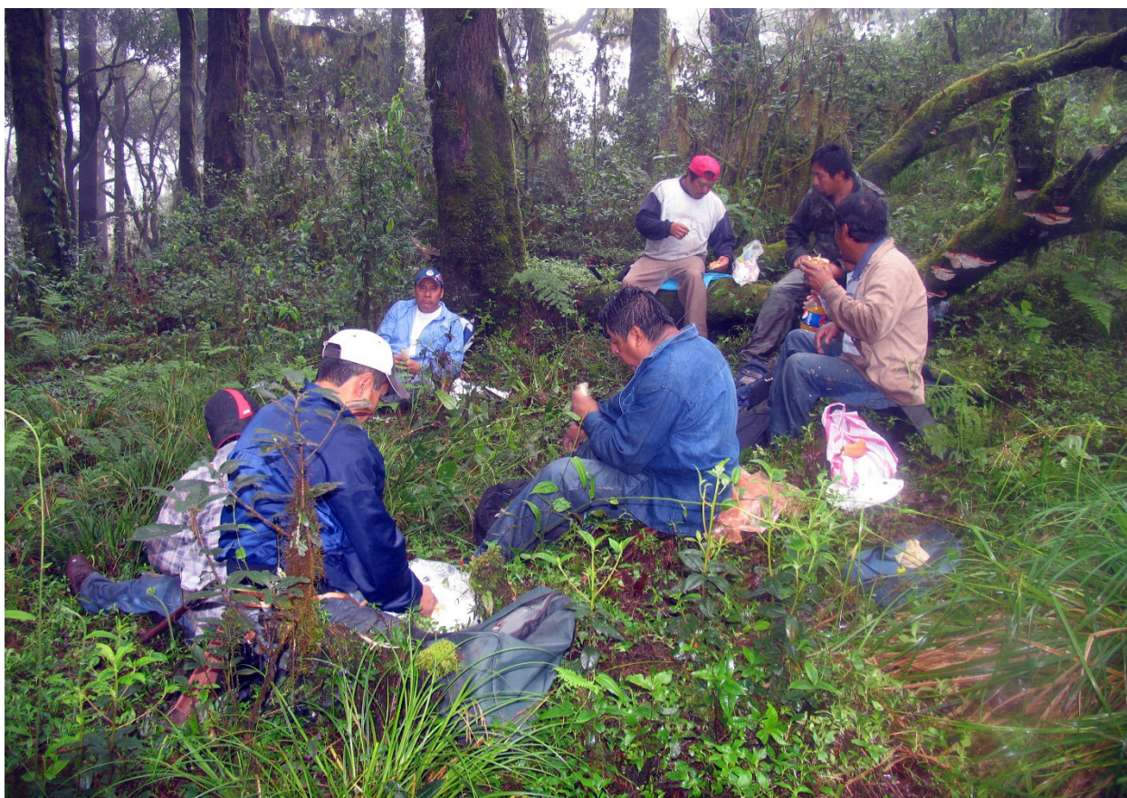
Ilustración 3. Comer y conversar son prácticas de la memoria que inscriben identidades en la Sierra Zapoteca de Oaxaca.

Me interesa la memoria social como un espacio de lucha política en donde los sujetos contestan y cuestionan las prácticas estatales que buscan subsumirlos dentro de las prácticas disciplinarias dirigidas a sus personas, sus espacios y sus vidas. Por ejemplo, la propiedad comunal en México tuvo de un lado un origen colonial; es decir derivó de las prácticas coloniales de control territorial y de la división racial entre pueblos de indios y pueblos de españoles; derivó de las políticas de control espiritual y de las normas del derecho colonial. Sin embargo, estas inscripciones o tecnologías que intentaron someter a las comunidades indígenas fueron reinterpretadas, usadas y recicladas a través del tiempo. Los Estados coloniales crearon una cartografía de simbologías, la requerida para crear identidades de sujeción. Sin embargo, las comunidades deslindaron y reconstruyeron esta cartografía para crear las propias. La memoria juega un papel crucial en estas interpretaciones y usos de la cartografía estatal.