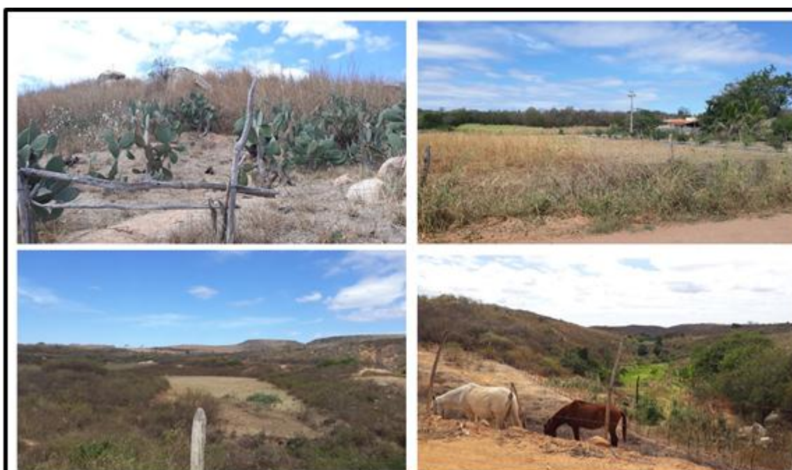
Figura 03 – Formas de uso e ocupação em comunidades rurais no município de Pereiro.

As atividades ligadas a agropecuária (figura 3) e ao extrativismo vegetal desenvolvidas no município, normalmente utilizando técnicas rudimentares, ocasionam agravos ambientais através do desmatamento, da compactação do solo e do extrativismo vegetal e mineral. Posto isso, as formas de uso e ocupação e as diferentes atividades em escala diferenciada, espaço-temporal, colaboram para a degradação ambiental em função da gestão deficiente de seus recursos naturais.