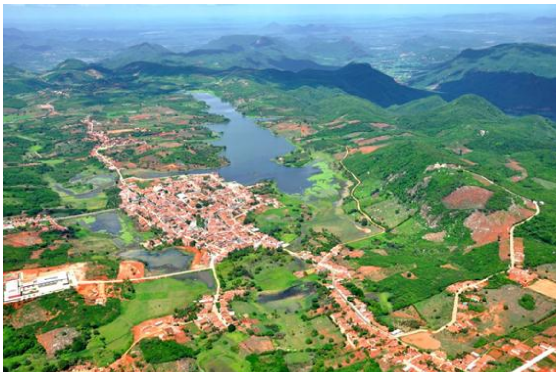
Figura 2 – Vista aérea da sede municipal de Pereiro.