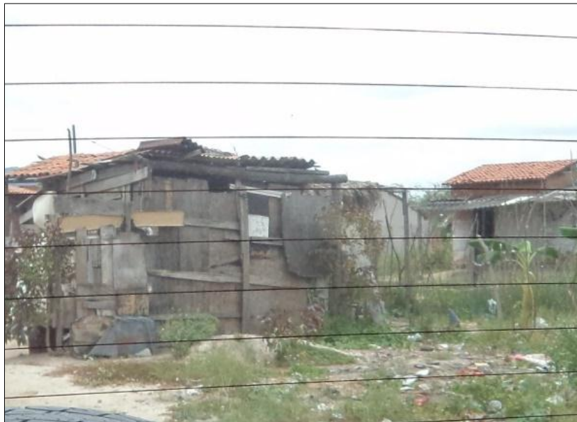
Figura 5 – Moradias com alta vulnerabilidade instaladas em área suscetível a alagamento (SR_2).

Já no setor SR_2, o aumento no número de imóveis foi bastante expressivo, bem como a elevação do grau de risco de alto para muito alto, resultado da alta vulnerabilidade das construções instaladas no local (figura 5).