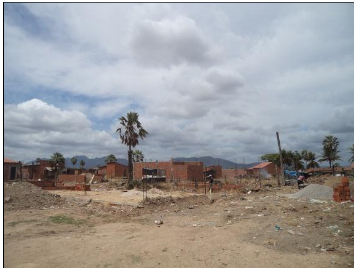
Figura 6 – Ocupação irregular em região de alta suscetibilidade a inundação (SR_3).

Além dos riscos relacionados com os processos hidrológicos, na segunda visita ao município constatou-se a manutenção dos problemas relacionados ao descarte incorreto dos resíduos sólidos e à presença de efluentes expostos (figura 7).