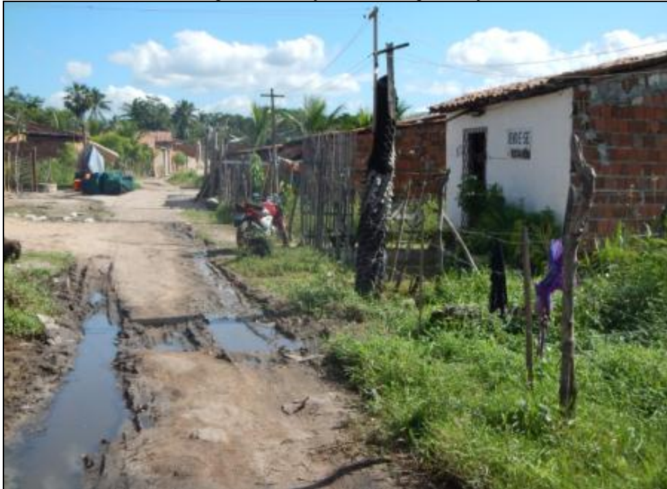
Figura 3 – Casas situadas em área alagável. Presença de lixo e esgoto lançados diretamente nas ruas (SR_2).