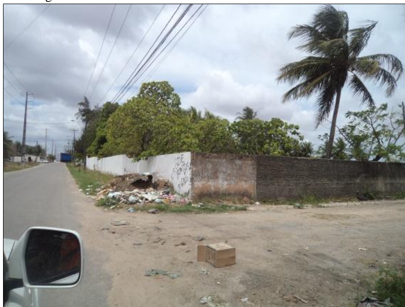
Figura 7 – Descarte de lixo e entulhos feitos de forma incorreta.