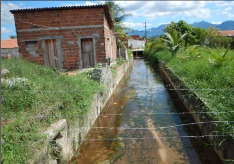
Figura 2 – Canal que corta o Loteamento Residencial Maracanaú. Em períodos de acentuada pluviosidade, o córrego transborda e atinge as residências situadas em suas margens (SR_1).

de 184 moradias nos setores de risco identificados, correspondendo a aproximadamente 736 pessoas expostas a risco alto e muito alto a processos hidrológicos.