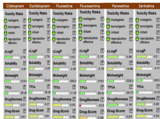
Figura 2 – Análise de múltiplos parâmetros realizados no OSIRIS Property Explorer dos fármacos protótipos.

Há quase 20 anos, descobriu-se que mutações no hERG poderia causar longa síndrome do intervalo QT. A proteína codificada pela sigla hERG foi mais tarde identificada como um canal de íons cardíacos seletivos de potássio, que nesse caso apontado pela tabela 3 é possível observar o risco que cada molécula pode causar inibições a essa proteína e gerar problemas cardíacos. No caso observado, apenas a molécula da fluvoxamina apresentou baixo risco de causar problemas cardíacos, já as demais moléculas apresentaram médio risco para a capacidade de inibição do hERG