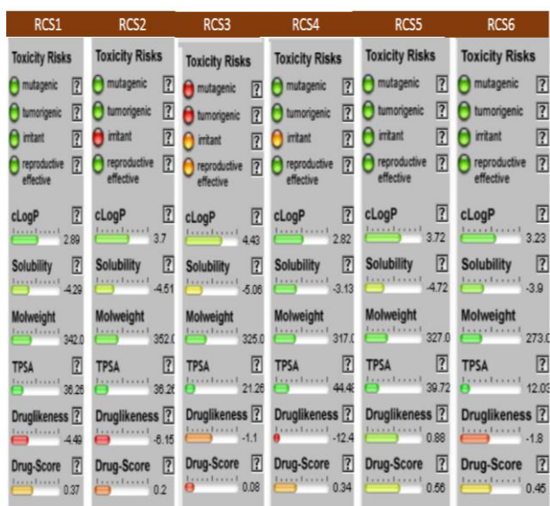
Figura 3 – Análise de múltiplos parâmetros realizados no OSIRIS Property Explorer dos fármacos análogos.

A figura 2 mostra que os resultados relacionados ao risco de toxicidade de todos os fármacos protótipos estão enquadrado como desejáveis, pois estão representados em verde, ou seja, tanto a mutagenicidade, quanto a tumorigenicidade, os efeitos irritantes e os efeitos sobre a capacidade de reprodução humana estão de acordo com o esperado, assim como parâmetros relacionados ao log P (que mede a lipofilicidade), à solubilidade, ao peso molecular, à polaridade e ao drug-score (que mede a capacidade da molécula ter propriedades suficiente para ser empregada na terapêutica. O druglikeness mede a capacidade da molécula apresentar semelhança a um fármaco foi favorável para todas as estruturas dos protótipos a exceção da fluvoxamina.