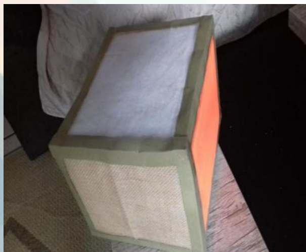
Figura 11: cubo sensorial

CUBO SENSORIAL- É utilizado para desenvolver a percepção visual e tátil. Feito a partir de uma caixa de papelão onde cada face tem uma textura diferente. Deve ser aproximada da criança para que ela toque com as mãos e os pés percebendo cada textura.