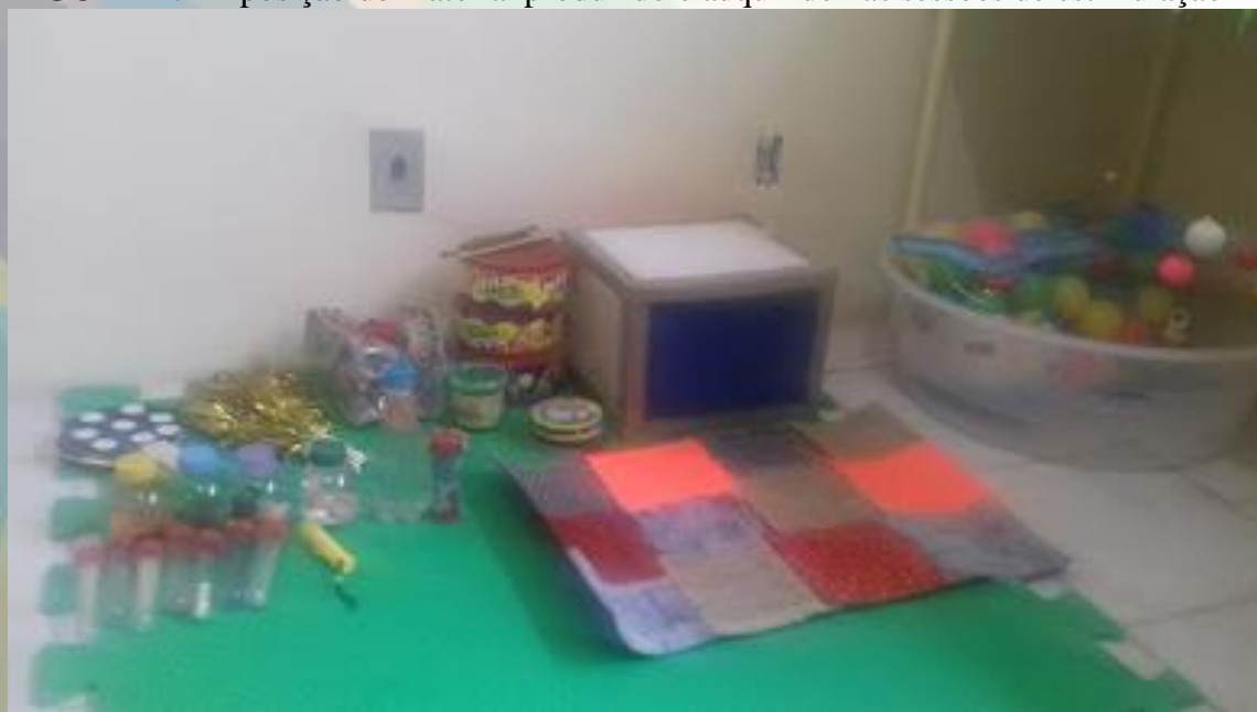
FIGURA 1: Exposição do material produzido e adquirido nas sessões de estimulação

Os objetos pedagógicos produzidos foram armazenados em uma caixa para ser utilizada no próprio lugar da pesquisa nomeada Caixa de Estímulo Sensorial: Vamos Despertar!!!!