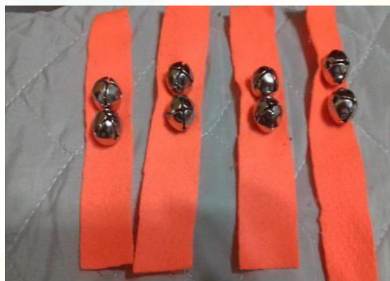
Figura 16: Pulseira e Tornozeleira

(braços e pernas). Deve ser costurado guizos em cima, pois ao movimento das mãos e pés, emite sons, estimulando a audição.