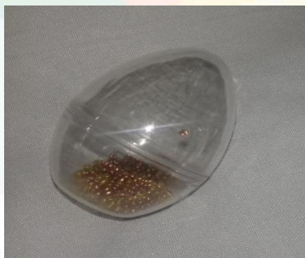
Figura 14: Ovinhos Barulhentos