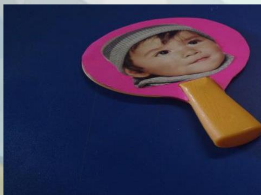
Figura 5: Carinha sapeca feita com raquete de tênis de plástico

CARINHAS SAPECAS- Utilizado para desenvolver a coordenação olho-mão, pode ser confeccionado a partir de uma raquete de tênis e figuras de faces variadas. Pode ser usada aproximando o material ao rosto da criança para que ela observe a imagem, onde o adulto fala o nome de cada parte do rosto e em seguida tocando a mesma parte no rosto da criança.