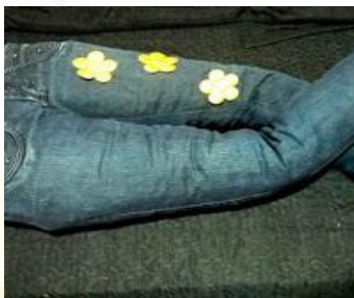
Figura 4: calça da vovó

CALÇA DA VOVÓ- Calça jeans usada preenchida com flocos de espuma ou retalhos de tecidos ou outro material, também pode ser costurado apliques variados e guizos para provocar a curiosidade da criança. Possibilita o posicionamento do bebê durante a sessão de estimulação. É usada para colocar a criança deitada, de bruço ou sentada durante a atividade.