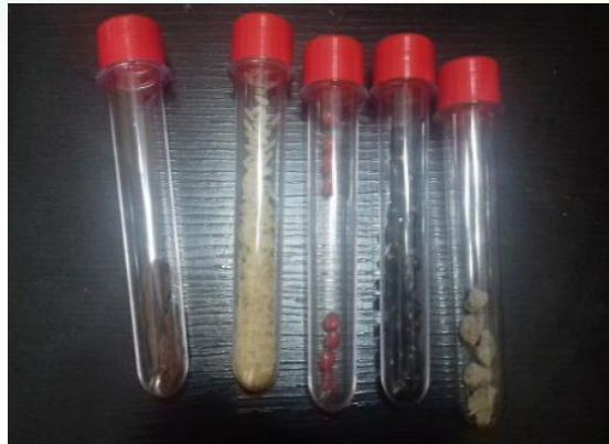
Figura 6: chocalhos divertidos

confeccionado a partir de tubetes de festas, inserindo diferentes tipos de grãos e sementes e /ou outros objetos que produzam sons variados.