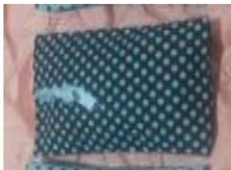
Figura 2: almofada com cheirinho de erva-doce

ALMOFADAS COM CHEIRINHO- Material de Estimulação olfativa, visual e tátil, composto por retalhos de tecidos costurado em forma de retângulo, recheado com algodão e outros elementos exalem cheiro: cravo, pó para gelatina, pó de café, erva-doce e outros.