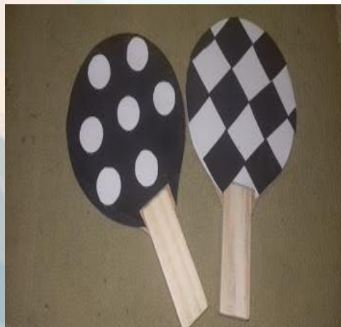
Figura 7: contraste legal

CONTRASTE LEGAL- Usado para estimular a percepção visual. É confeccionado a partir de raquetes de tênis e emborrachado branco e preto, colados com cola quente nos dois lados da raquete.