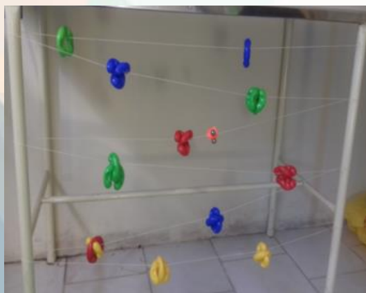
Figura 9: Corda Sensorial

CORDA SENSORIAL- Este material estimula as áreas visuais, auditivas e táteis e estimula a coordenação dos movimentos. É confeccionado a partir de uma corda (barbante) preso aos pés da mesa. Assim, é preso jogos de encaixe e guizos. O adulto deve colocar a criança próxima à corda e incentivá-la à tocar na corda para balançar os guizos e tocar nas peças de encaixe colorida.