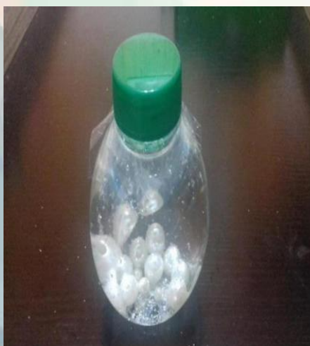
Figura 15: Pote da Calma que Acalma

POTE DA CALMA QUE ACALMA- Estimula a visão e a coordenação olho-mão. Feito a partir de potes transparentes com água, acrescentando miçangas, glitter colorido e materiais diversos: pérolas, bonequinhos, miçangas e outros.