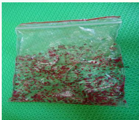
Figura 18: Sacos Sensoriais

objetos de plástico e etc. Eles desenvolvem a percepção visual e tátil. Deve ser utilizado para que a criança toque com as mãos e/ou pés.