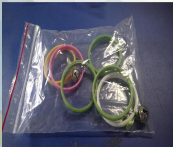
Figura 3: argolas coloridas com guizo dentro de um saco plástico

ARGOLAS COLORIDAS COM GUIZO- Usado para desenvolver a coordenação olho-mão e a percepção auditiva, este material é uma junção de argolas coloridas com guizos presos nelas.