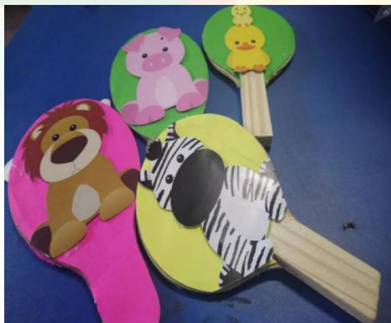
Figura 10: raquetes de madeira com imagens de animais colados, formando o material “Imitando os Animais”