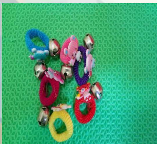
Figura 17: Pulseirinhas Fofas

PULSEIRINHAS FOFAS - Também usado para desenvolver a coordenação olho-mão, incentivar os movimentos dos membros superiores e estimular a visão e audição. Este material é produzido a partir de xuxinhas de cabelo com enfeites de bonequinhos e guizos. Ao movimento dos braços a criança é atraída a olhar pelo som provocado.