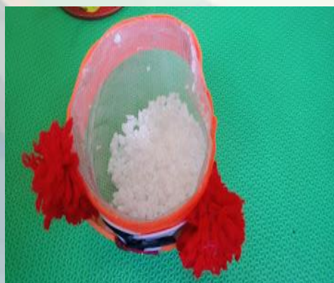
Figura 19: Soprando o palhaço

SOPRANDO O PALHAÇO- Feito com uma garrafa pet cortada, coberta por um filó para cobri-lo e com flocos de isopor dentro, este material pode ser decorado por fora com a cara de um palhaço. Ele estimula a imitação e desenvolve a percepção visual e tátil. O adulto deve soprar na direção do filó para que as bolinhas de isopor se agitem e movimentem-se. A criança ao ver este gesto deve ser motivada a imitar o adulto.