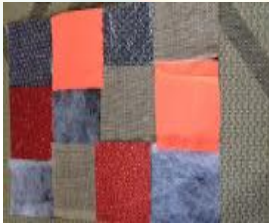
Figura 20: Tapetinho de Textura