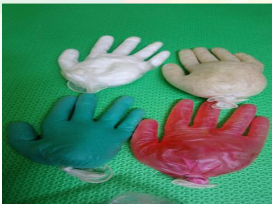
Figura 12: Luvas Sensoriais Divertidas