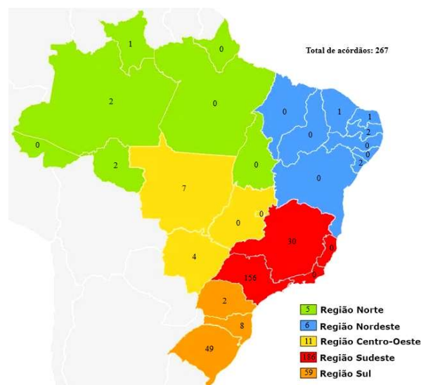
Mapa 1 – Número de acórdãos por Tribunal de Justiça