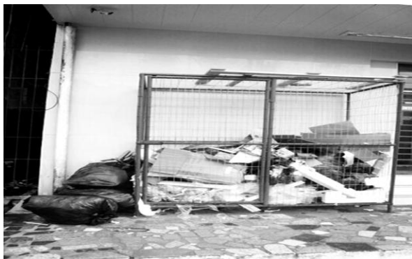
Figura 2 - Fotografia retrata forma inapropriada de depositar o lixo

Importante destacar o material de constituição das bancadas, sendo de madeira, de difícil higienização e não seguimento das normas de segurança alimentar, como bancadas laváveis de material não poroso. Nesse ambiente, observou-se que as práticas higiênicas refletiam hábitos socioculturais e concepções sobre limpo e sujo, em geral, cercadas de símbolos que retratavam saberes de uma cultura própria de quem vive, sobretudo, em precárias condições materiais.