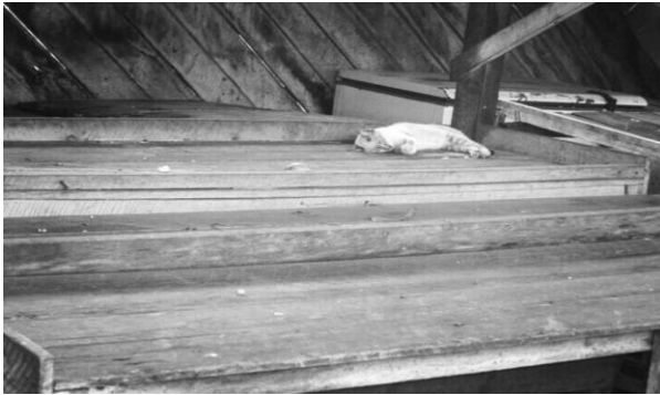
Figura 1 - Fotografia identificando gato na feira livre

este o local cujos alimentos, como frutas, verduras e carnes, são expostos à venda. A presença de animais pode veicular doenças por meio dos alimentos, como a toxoplasmose, acarretando desde cegueira a graves problemas de saúde ou ser letal em indivíduos imunocomprometidos.