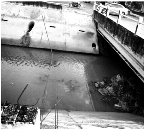
Figura 3 - Fotografia identificando canal de drenagem em um dos bairros selecionados

O desenvolver destas atividades permite inferir que as estratégias para promoção da saúde, de caráter empoderador, são aquelas que envolvem diretamente a participação dos sujeitos nas decisões, destacando-se a forma como estes fazem suas escolhas, mostrando estreita relação entre o potencial de participação dos sujeitos e a distribuição de poder nesses espaços de promoção da saúde (16) . Assim, a estratégia de ensino utilizada permitiu a reflexão para o empoderamento de estudantes que serão futuros enfermeiros.